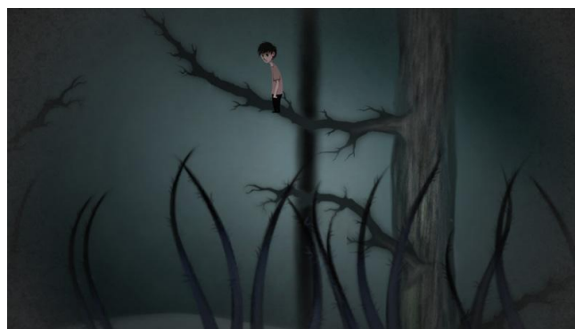
Figura 4 e 5: Game Elude, protótipo. MIT Gambit Game Lab, 2010. Disponível em: http://gambit.mit.edu/loadgame/prototypes_2010.php

Contando aqui com as possibilidades encontradas no meio, além da imersão e agenciamento, a possibilidade da transformação, os seus desenvolvedores puderam criar um cenário dinâmico que oscila rapidamente para refletir o desempenho do jogador. Trabalham com as propriedades do meio para refletir as mudanças de humor e comportamento a que estamos sempre sujeitos, merecendo destaque a orientação poética dada à essas propriedades, vistas como procedimentais, espaciais, participativas e enciclopédicas por Murray ( Op. cit. ).