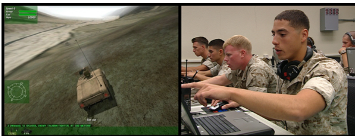
Figura 1 e 2: Filme Watson is Down , Farocki, 2009. Disponível em: http://www.ves.fas.harvard.edu/farocki_lecture.html

Em Watson is Down , temos um treinamento de uma operação de salvamento de soldado e resgate de veículo, em área dominada por combatentes inimigos, simulação que nos remete a um verdadeiro game de guerra, nos moldes dos best sellers da indústria do entretenimento Counter Strike e Call Of Duty . No filme o militar em treinamento recebe ordens de um instrutor e atua a partir da interface gráfica e da utilização de mouse, como um jogador em um game de guerra, tendo o cineasta intercalado as imagens de sua atuação e de sua fisionomia nos momentos de maior tensão. A simulação combina precisamente dados obtidos via satélite para simular, com extrema precisão, áreas reais de conflito no Afeganistão.