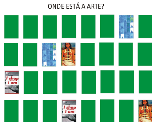
Figura4: imagem de Onde está a arte?

Em ambos os jogos há um elemento comum, o "objetivo" não está no fim, mas no meio. Uma hora o jogo acaba, mas o durante, o jogar é mais importante do que tentar finalizá-los. Tenta-se buscar esse jogo desprezioso, sem nenhuma outra finalidade que a pura vontade de interagir, de jogar. Até o presente momento se fez necessário pontuar as