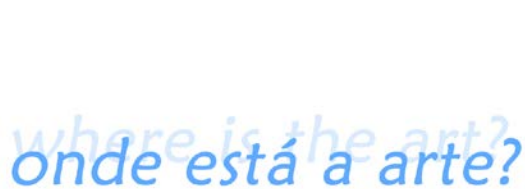
Figura3: Abertura de Onde está a arte?