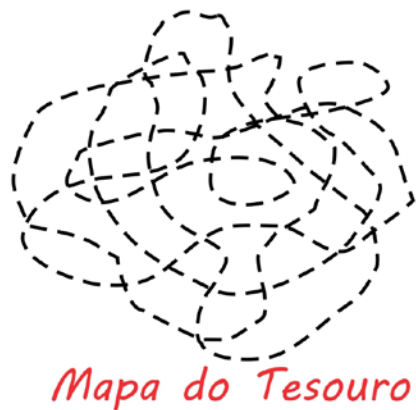
Figura1: Abertura de Mapa do Tesouro

"Mapa do Tesouro" é um jogo onde não há mapa e nem tesouro, pelo menos um tesouro material, o tesouro proposto é a própria ação reflexiva acerca do que consideramos prioritário, pensar o que seria o tesouro que buscamos. "Onde está a Arte?" foi pensado para ser um jogo da memória insolúvel. O jogo se dá em tentar achar onde estão os pares de obras de arte escondidas, porém nunca será possível encontrar. "Onde está a Arte?" busca refletir sobre a produção artística, onde achar a arte, e se um jogo pode ser arte, se o próprio "Onde está a Arte?" poderia ser considerado arte.